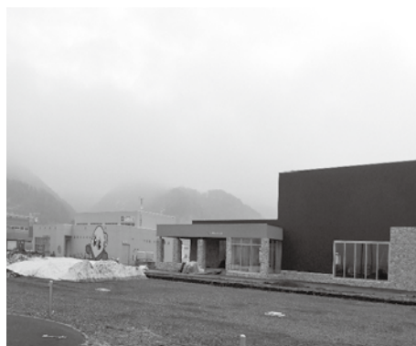
▲アウトドア・アクティビティ拠点施設にモンベルが進出