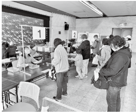
▲プレミアム商品券の販売会場の様子

答弁 生活者支援事業「お米券支援」 は、約8割が引き換えた。「プレミ アム商品券」発行事業は、3万冊を 印刷。高齢者に配慮したサービスの 向上に取り組み、予想を上回る販売 状況で、在庫切れを起こさないよう 3千冊を増刷したい。