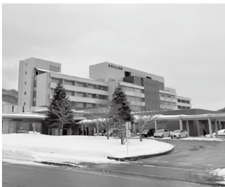
▲非常に厳しい経営状態の留萌市立病院

現在、市立病院の経営強化プランに基づく令和7年度の取組について、事業管理者として進捗と成果をどのように評価しているか伺う。