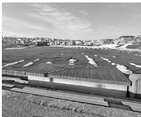
▲見晴公園野球場 老朽化が進み、利用環境の改善が求められている

答弁 公園の整備については、老朽化や安全性、利用状況を踏まえ総合的に判断し、今後、再編や役割分担についても検討していく。