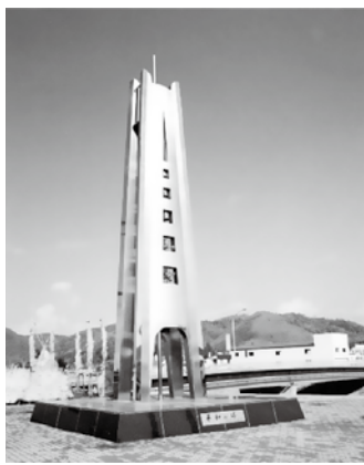
▲南町に建っている「平和の塔」

図書館関連事業の平和資料展やアニメ・記録映画上映会などを通して、戦争の犠牲者に対して、追悼の意を表するとともに、戦争の悲惨さや平和の大切さを後世に伝承する取組を行っている。平和都市宣言にある「恒久の平和を願い幸せな市民生活を守る」ため、市民の皆さんとともに、平和の取組を進める。