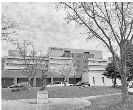
▲留萌市立病院の安定的な運営は、二次医 療圏の持続的な基盤整備としても重要。

「将来に渡って市民が安心して医 療を受けられる体制づくりに移め る」との所信表明に込めた想いと、 今後の二次医療圏としての責務につ いて、市長の考えを伺う。