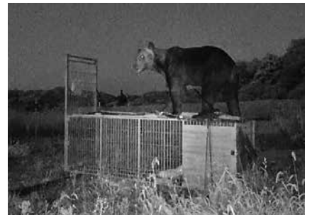
▲有害鳥獣駆除事業

A 鳥獣被害対策実施隊員報酬は、緊急出動1回に対し1万円を90回分で積算。緊急出動とは、ヒグマの出没、箱わなの設置や餌等の管理、捕獲された場合などにする出動のこと。令和8年度は若手を参加させてほしいという希望があり、余裕をもって積算。報償金は、ヒグマ10頭を捕獲する計画で、1頭捕獲ごとに2万円を支出する。