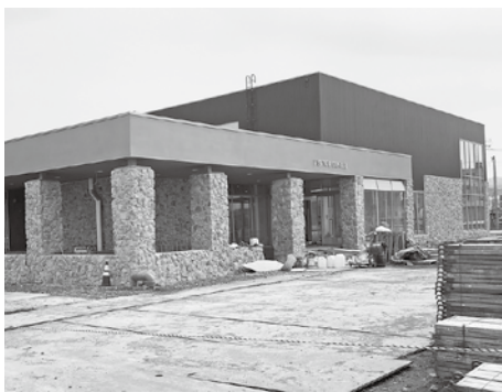
▲モンベルショップが入る予定の建設中 の「アウトドア・アクティビティ拠点施 設」

答弁 市役所の快適な職務環境を提 供しつつ、必要な規模とスケールで なるべく金額的に抑えられる見直し 再検討という観点は必要になる。施 設完成後の償還の財源、庁舎の維持 管理費、光熱費などの費用を計算し て、どの程度の財政負担であればや つていけるのか精査したい。