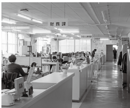
▲7月に人事異動を予定

人事異動について検討されていると思うが「視点、規模、何時か」を伺う。 答弁 現行組織の課題を十分に把握、整理の上で、政策予算をお示しする第2回定例会の経過を踏まえ、その内容を組織体制に反映させるため、7月をめどに行っていきたい。