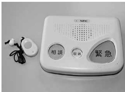
▲緊急通報システム

A 地域生活センターやケアマネージャー、民生委員からの相談があった場合や、地域包括支援センターの相談事業、ケアマネージャー連絡会議、民生委員への説明など、様々な機会にPRしている。また、地域包括支援センターが独自で作成している高齢者福祉サービスのパンフレットやホームページでも周知している。