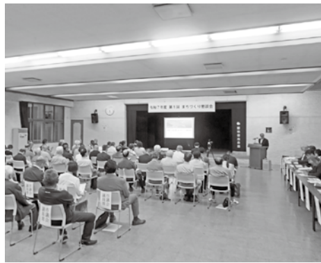
▲令和7年度第1回留萌市まちづくり懇談会