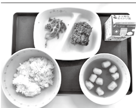
▲献立：ごはん、すまし汁、たらのみそライ、こんにゃくきんぴら、牛乳

小学校対象の国の「学校給食費の抜本的な負担軽減」に基づき、国の支援基準額を超える差額については市が支援することで、実質的に小学校の学校給食費を無償化とする。