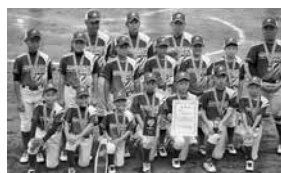
▲阿波おどりカップ全国学童軟式野球大会2025に出場した留萌JBCのメンバー

第5次留萌市子どもの読書活動推進計画（素案）、令和7年度学校給食に係るアンケート調査結果について説明があった。議案事項として、令和7