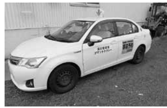
▲JR留萌線の廃止に伴い、早朝及び夜間時間帯に運行しているデマンドタクシー車両

留萌市南部3市町し尿処理の今後の方針検討結果について報告を受けた。また、令和8年度都市環境部主要事業予算・留萌市下水道事業会計予算・留萌市水道事業会計予算・留萌市下水道条例の一部を改正する条例制定について確認した。このほか、昨年8月に発生した送水管漏水事故の最終報告について確認した。