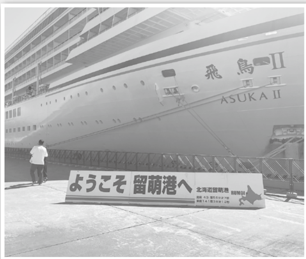
▲留萌港に寄港した飛鳥Ⅱ（昨年9月）