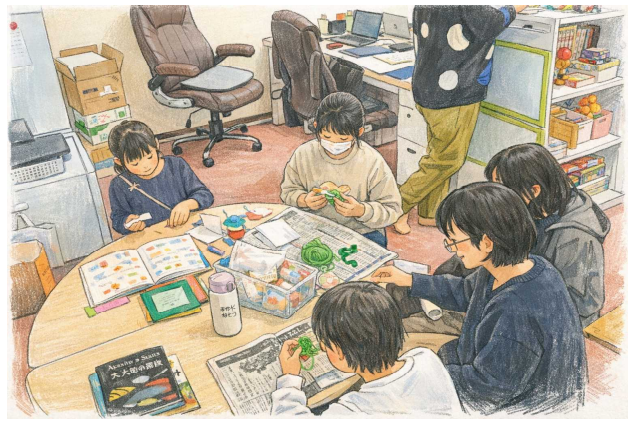
「ゆるくるも」での自由時間。女子が集まって手芸をしているところです。

令和8年度も、今年度から引き続き入級しようと考えている子ども、新たに入級してくる子どもがいると思います。今後もその子が所属する学校の先生方と支援目標を共有しながら取組を進めていきたいと思っています。次年度もたくさん学校をお邪魔するとは思いますが、「ゆるくるも」の取組をご理解いただき、今年度と変わらぬご協力を賜ればと思います。よろしくお願いいたします。