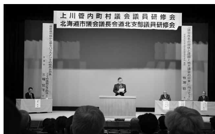
▲道北支部議員研修会開会式