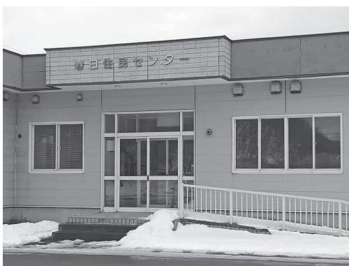
▲春日住民センター

域住民の意向で決まった場合、高齢化の進展などによって、施設の維持・管理にあたり、将来に向けた費用負担について心配する声も伺っている。高齢化率などの地域特性を考慮するなど、今後に向け、どの地域に住んでいても、安心して暮らせるという制度を検討し、構築できないか伺う。