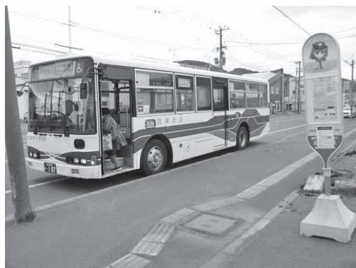
▲令和7年から始まった高齢者市内バス無償化

【答弁】 私の市政の検証と今後の展望については、「市民・民間活力と共に希望が開く留萌へ」を理念に公約を掲げた「5つの実行」の実現に向け市民、市議会議員の皆様や経済界の皆様との対話を常に心がけ、全力で市政に取り組んできた。人口減少の中にあっても地元業者がしっかりと経済を回すことで、市民の生活力や暮らしを豊かにするためにも将来を見据えた財政運営により持続的な街づくりを進めていく。