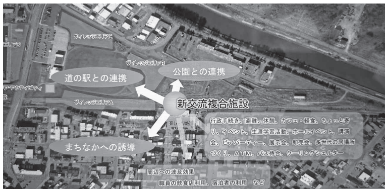
▲建設予定の新交流複合施設を中心とした周辺イメージ

しながら、賑わいの創出、人流をつくることと併せて、街中への誘導を目指すことを地区の将来像としている。今後も周辺エリアへの民間投資や商業集積などの誘導支援策を講じながら、地域の賑わいの復活への展開などを全体像として思い描いている。