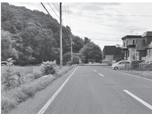
▲今後の歩道整備計画は

令和5年度に鉄道遺産活用可能性調査を実施し、今後については、こうした調査結果や提言書の内容、さらに周辺の鉄道関連施設の状況も踏まえ、エリア全体の回遊性向上に資する形で鉄道遺産を観光コンテンツとしてどのように位置づけ、活用していくか検討を進めていく。