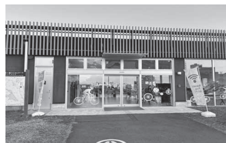
▲「りんりんポート土浦」

土浦市は、約180キロのりんりんロードを核に、拠点整備とレンタサイクル等で交流を創出している。他市町村と連携も行われ、効果の見える化と体験コンテンツ拡充を進めていた。拠点「りんりんスクエア土浦」にはシャワーやロッカー、ショップが集約され、利用者は年々増え、消費額は28億円超と試算されると説明を受けた。