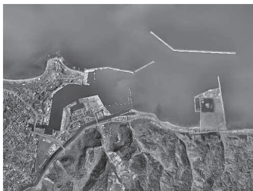
▲空からの留萌港

【答弁】 会計年度任用職員の公募に関する調査は、令和7年6月19日付けで北海学園の川村教授から調査依頼があり、回答を実施。留萌市では、初めて会計年度任用職員として採用する場合には、原則として公募によるが、再度の任用については、公募試験は実施していない。