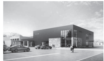
▲アウトドア・アクティビティ拠点施設

報告事項として生活者支援のための上下水道料金免除について、議案事項として令和7年度留萌市一般会計補正予算(第8号)、専決処分(訴えの提起)、情報提供事項として神居岩パークゴルフ場の窓口業務休止の試行結果について、留萌市都市計画マスタープラン及び立地適正化計画について、第3期留萌市生活排水処理基本計画(素案)、令和6年度版留萌市の環境について説明を受けた。