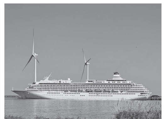
▲来年寄港予定の飛鳥Ⅱ(写真)と飛鳥Ⅲ

【答弁】 人口減少に伴い児童・生徒数は5年前より20%以上減少。小規模校では、教育課程への影響、学校行事の開催方法、複式学級編成など毎年苦慮している。人口減少下、望ましい教育環境の確保や適切な学校配置について、児童生徒、保護者、教職員、地域への影響を踏まえ、適正規模化の必要性を認識している。