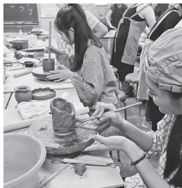
▲留萌市国際交流協会が開催した外国人技能実習生の「陶芸体験」

さしい日本語」の普及啓発、ごみ出しルールや防災情報の確実な提供、円滑な入居につながる住居の確保等の支援を検討していく。また、国際交流協会を通じた交流機会の充実も図り、外国人住民が安心して暮らせる環境づくりと、文化を尊重し合える地域土壌の醸成を進め、国籍にかかわらず、誰もが留萌に住んでよかったと思えるまちづくりの実現に向け、取り組む必要があると考えている。