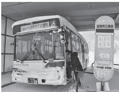
▲市民の通院をささえる公共交通

答弁 「5つの核・拠点」を確実に推進することにより、「高校生が地元に残りたい」「いざれ地元に戻って働きたい」と思ってもらえる環境に繋げていく。ソフト面については、ふるさと納税寄附金の活用を含め取り組んでいきたい。ハードについては、財源の確定ができるものが優先順位となってくると考える。留萌の魅力づくりと住みやすい環境を作っていくことが大事であり、国の状況や交付金などを職員と協議を行いながら、事業効果を上げられる状況を作って行きたい。