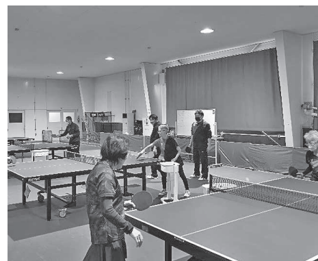
▲高齢者対象の卓球講習会