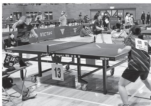
▲『小林杯争奪対抗卓球大会』でがんばる地元の子どもたち

VICTASとの連携による卓球まちづくり推進事業が始まって3年。市民のため、とりわけ地元のクラブチームで力をつけてきた子どもたちのためになった事業だったのか疑問がある。検証し、考え直すべきと考えるが市長の見解を伺う。