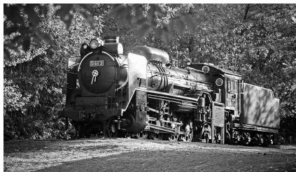
▲見晴公園のD61機関車

A新たな観光客の誘客を図るために、見晴公園のD61機関車の移設に係る調査設計を行う。