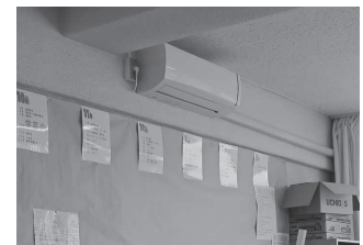
▲設置が予定される空調設備

保するための公立病院経営強化ガイドラインに基づき、直面する課題に的確に対応するとともに、更なる経営強化の取組などを盛り