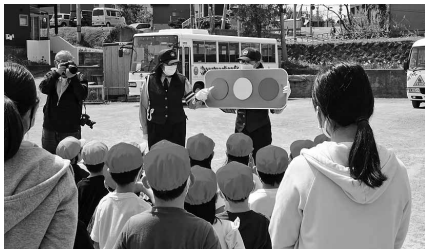
▲子ども交通安全教室