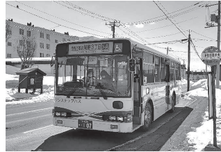
▲市内近郊線の沿岸バス

【地域振興部】議案のほか、情報提供事項として高齢者市内バス利用促進実証実験事業の利用者アンケート集計結果の説明を受け、今後の事業見通しについて確認。「道の駅るもい」の災害発生時における事業継続計