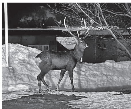
▲住宅街での出没も多いエゾシカ

目撃情報及び出没等があった場合には、警察、鳥獣被害対策実施隊員等と連携し、現場周辺の確認や注意看板の設置などの住民への啓発を行うことで人身被害防止に努める。