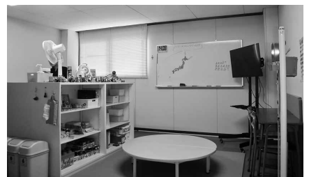
▲「ゆっくるも」の指導空間

A現在、小学校で7人、中学校で9人が通級。人数は増えている傾向にある。更に指導員の確保が必要だと認識している。