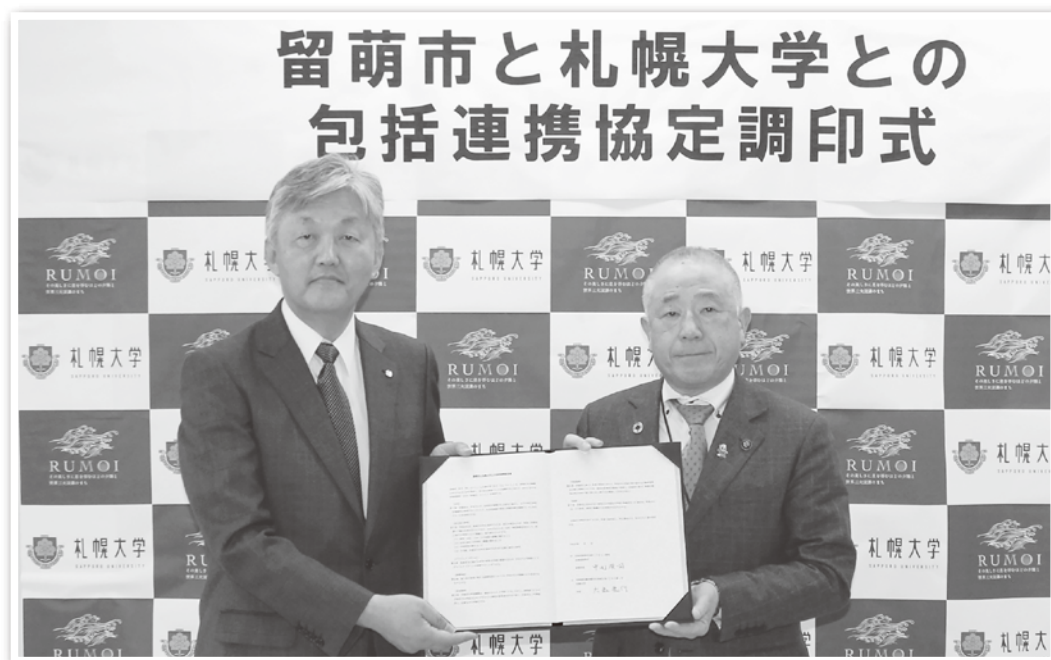
▲包括連携協定を締結した札幌大学の森義行学長（左）と中西俊司市長

▼留萌市と札幌大学は令和6年3月29日に、地域社会の振興に寄与する人材を育成し、活力ある地域づくりに向け協働するため、札幌大学と包括連携協定を締結いたしました。