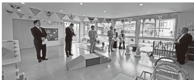
▲子育て支援センター「わかあゆ」

積水ハウス株式会社グループと事業締結し、子育て支援住宅「エミナール那珂川」を整備。隣接して子育て支援センター「わかあゆ」を配置するなど、子育て世代が安全、安心に暮らして行ける施策を調査した。その他にも、那珂川町ファミリー・サポート・センターが実施する登録制の子育て支援施策についても説明を受けた。