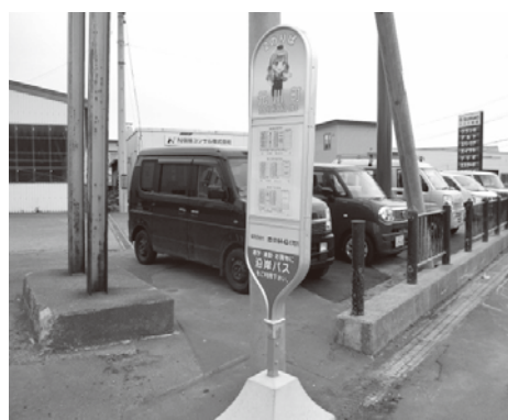
▲学生の利用が多い停留所

留萌市地域公共交通活性化協議会において、今後のこの協議会における懸案事項について、市の考えを聞きたい。また、市内路線バスの減便により通勤通院が不便になった、公共施設に停留所が少ないなどの声がある中、市としてバス事業者に要望を出す考えがあるか聞きたい。