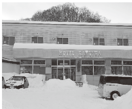
▲留萌市内唯一の公衆浴場

神居岩は「その他の公衆浴場」との許可であることから、補助対象外の施設となっている。今後、他自治体の状況を調査し要綱の改正などを検討したい。