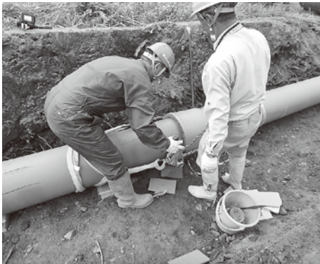
▲水道工事作業の様子

実証実験の状況を把握し、次年度の運用等について高齢者の期待に応えられるよう、検討をする。