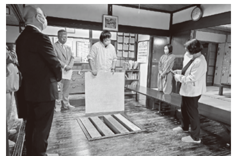
▲フリースペース「ひよこの家」

平成15年より、表面的な学校復帰を目的とせず、子どもたちが安心して心を休ませ、自分らしい自分を発見し社会的自立を目指すことを目的とし開設している、フリースペース「ひよこの家」を調査した。留萌市でも令和5年度から教育支援センター「ゆっくるも」が開設されており、議会としても本視察での学びを活かし、しっかりと支えていきたい。