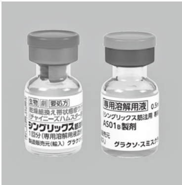
▲带状疱疹ワクチン

答弁 带状疱疹の予防のためのワクチンは「予防接種法」で「任意接種」ワクチンとなっている。带状疱疹予防のためのワクチン接種が高額であることなどから発症予防のためのワクチン接種への支援要望があることも承知しており、実施する場合の施策について検討していく。