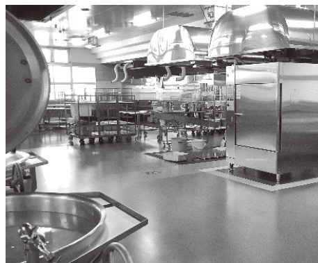
▲民間売却を検討される学校給食センター内のお様子

給食無償化のために、毎年6千万円を出していくことは非常にきびしい。この案件については、こども家庭庁を含めた国の教育に対する子ども施策を、もう少し見極めていきたい。