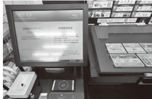
▲証明書が発行できるマルチコピー機

市民健康部から、令和5年12月11日から開始される証明書のコンビニ交付サービスについての説明を受ける。取得できる証明書は『住民票の写し』『印鑑登録証明書』で、マルチコピー機が設置されている、コンビニエンスストアやマックスバリュ、サッポロドラッグストアなどで発行できるが、発行にはマイナンバーカードとその暗証番号(利用者証明者用の数字4桁)が必要となることを確認した。