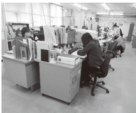
▲業務処理を行う職員のみなさん

〔答弁〕 期末手当は、職務や業務内容を考慮し、常勤職員の中でも再任用職員の基準に準じて取り扱う制度設計としている。ただ、制度開始から一定程度期間がたっており、行政サービスの複雑化、多様化していく中、常勤職員との均衡を図ることを基本に、職務に応じた適正な処遇に向け、また、勤め手当についても同様に適切な処遇となるよう、職員団体と引き続き協議を行っていく。