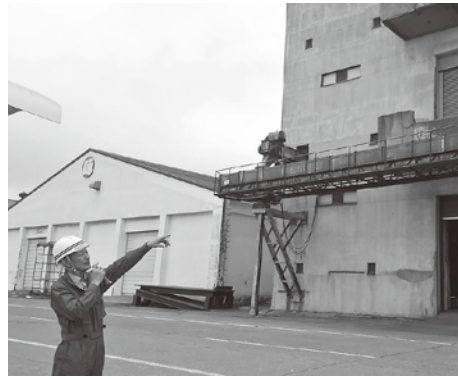
▲老朽化が激しい昭和42年建設のバラ化小麦倉庫

ホクレンから3万6千トンの小麦オーダーは十分可能であり、全面的に協力する合意を得ている。概算事業費は、約20億円。国の補助採択に向けた手続きを進めている。