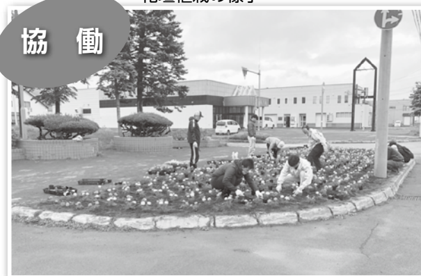
▼環境美化パートナー制度の広路花壇植栽の様子

市主催の「クリーンアップ日本海」などの清掃活動へ積極的に参加しましょう。参加しやすい環境づくりを進めるためには、職場などの支援も必要です。