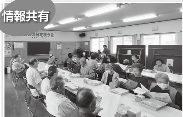
▼お茶の間トークの様子

また、市民がまちづくりの直接的な行動を取ることが「市民参加」の原則です。市民は市政に関心を持って積極的に行動し、市は皆さんが参加しやすい環境作りに努めています。