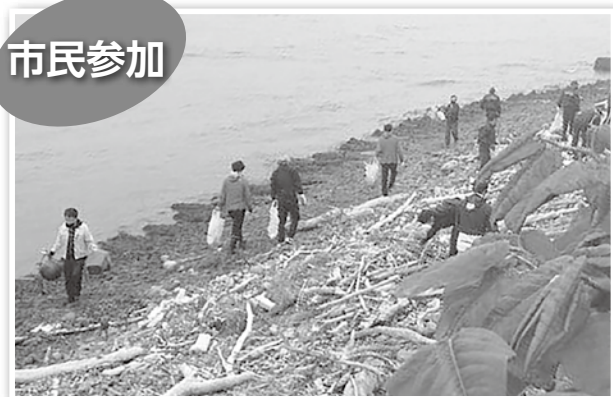
▼クリーンアップ日本海の様子

市が開催する「まちづくり懇談会」などでは、今後の市政運営に関する情報を得ることができるので、未来を見据えた活動が可能になります。