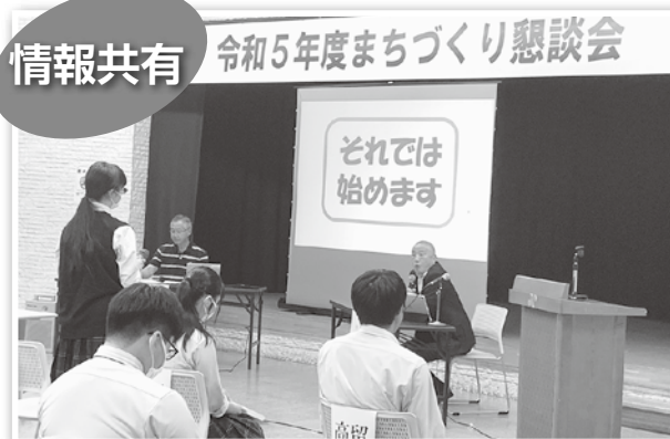
▼まちづくり懇談会の様子

市が実施する「お茶の間トーク（出前トーク）」や広報誌「広報留萌」などを活用してまちの情報を集めることが、自治に参加する際に役立ちます。