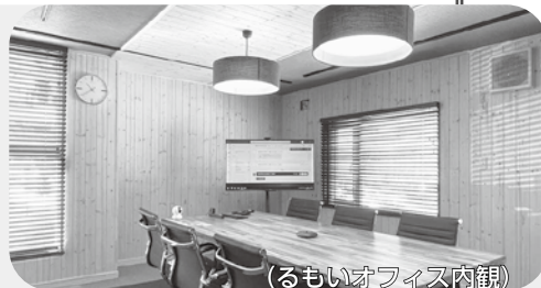
(るもいオフィス内観)