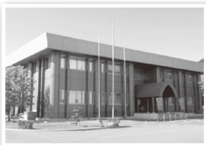
▲留萌浄化センター

▼留萌浄化センターでは、家庭や事業所などから出された汚水を浄化し、きれいな水にしています。