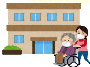
高齢者施設など に行くとき