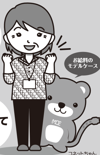
お給料の モデルケース