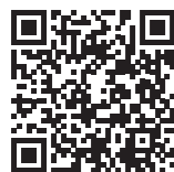
▲広報紙「ほっかいどう」

▼広報紙「ほっかいどう」は、道民に広く道政情報を提供し、情報の共有化と道政参加の促進を図るため、道内の各家庭に配布するとともに、コンビニや金融機関などに設置しています。令和3年度からは、多くの皆さんに広報紙を読んでもらうため、ウェブ版の掲載をスタートしました。広報紙「ほっかいどう」ウェブ版は、北海道ホームページ ( https://www.pref.hokkaido.lg.jp/ ) から閲覧いただけるほか、電子書籍ポータルサイト「Hokkaido ebooks」でもご覧いただけます。詳しくは、下記へお問い合わせください。