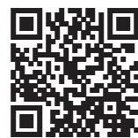
▲電子書籍ポータルサイト「Hokkaido ebooks」

※「Hokkaido ebooks」をスマホ、タブレットでご覧いただく際は、専用アプリが必要となります。