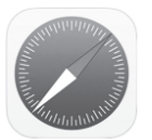
Safari(サファリ)のアイコン