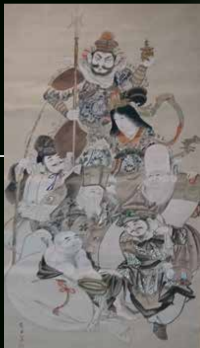
( 蓼沼ナヲ筆 「七福神の図」 )

郷土留萌の自然や歴史・文化を学ぶ講座です 全3回(全ての講座を通してではなくても参加いただけます)