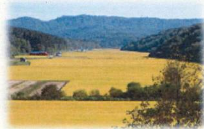
良食味米の稲作地帯