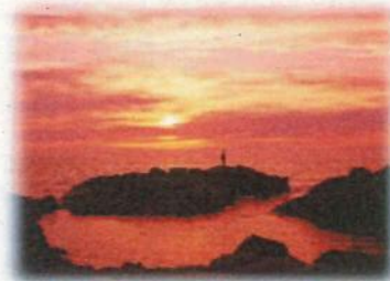
黄金岬に沈む夕陽