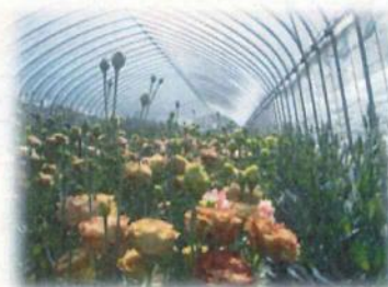
北限のトルコギキョウ