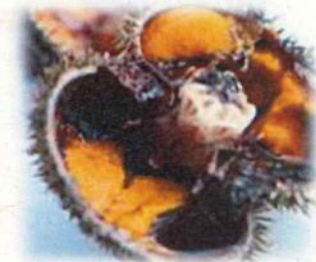
前浜で採れる新鮮なウニ