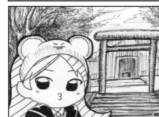
2020年は新型コロナの年になっちゃったけれど