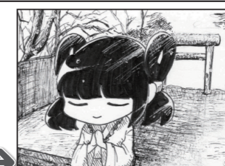
良い一年になりますように