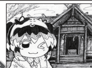
2021年は、また楽しいことができたらいいな