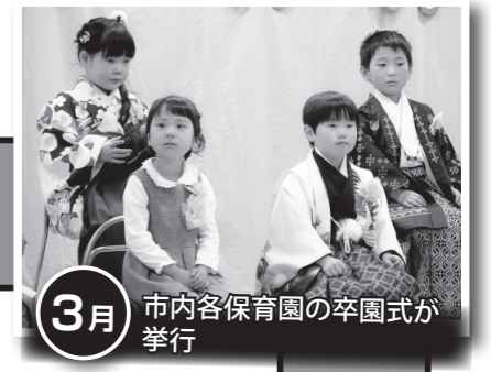
3月 市内各保育園の卒園式が挙行