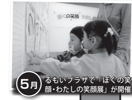
5月 るもいプラザで「ぼくの笑顔・わたしの笑顔展」が開催