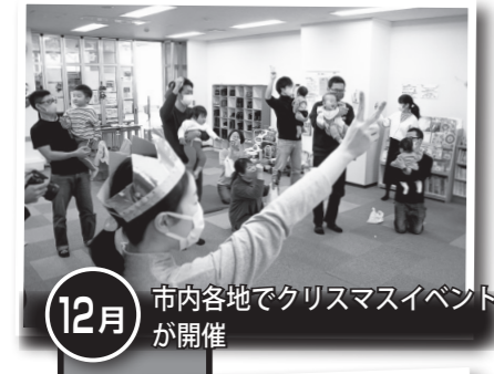
12月 市内各地でクリスマスイベントが開催