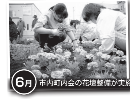
6月 市内町内会の花壇整備が実施