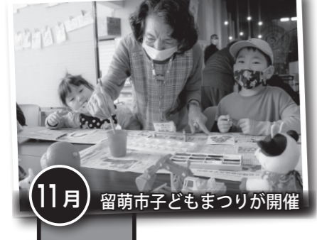
11月 留萌市子どもまつりが開催