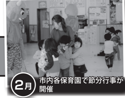
2月 市内各保育園で節分行事が開催