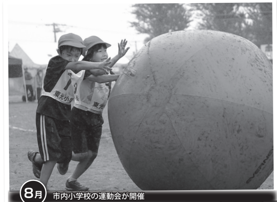
8月 市内小学校の運動会が開催