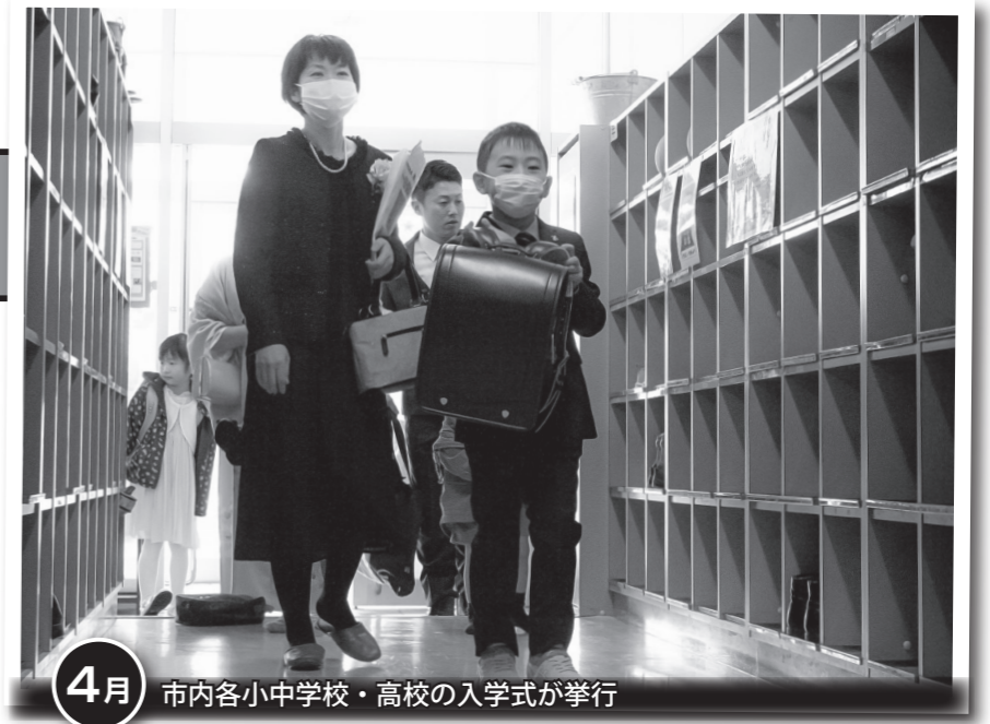
4月 市内各小中学校・高校の入学式が挙行