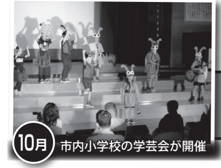
10月 市内小学校の学芸会が開催