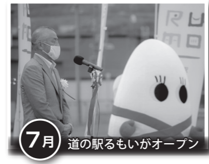
7月 道の駅るもいがオープン