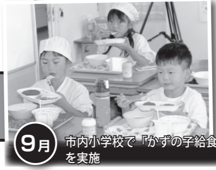
9月 市内小学校で「かずの子給食」を実施