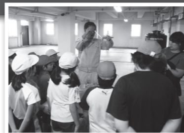
▲汚水処理の仕組みを学ぶ子どもたち