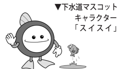
▼下水道マスコットキャラクター「スイスイ」

その後、平成13年に旧下水道法制定100年を記念して改称され、「下水道の日」となりました。