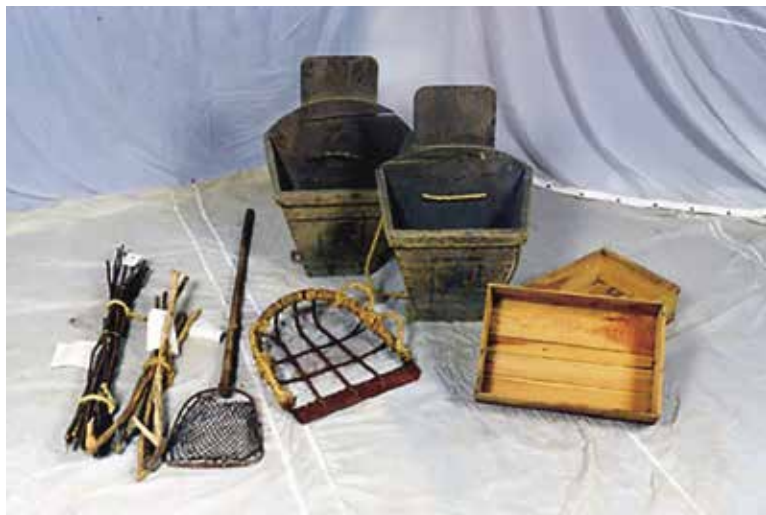
おきあかんけい 沖揚げ関係用具