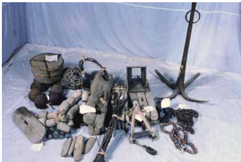
あみかんけい 網関係用具