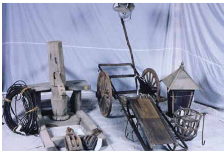
施 し 設 せつ ・設 せつ 備 び 関 かん 係 けい 用 けい 具 けい