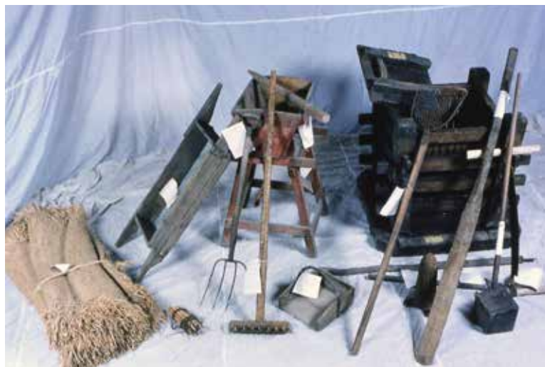
ニシン し 絞 かす め せい 粕 ぞう 製 かん 造 けい 関 けい 係 けい 用 けい 具 けい