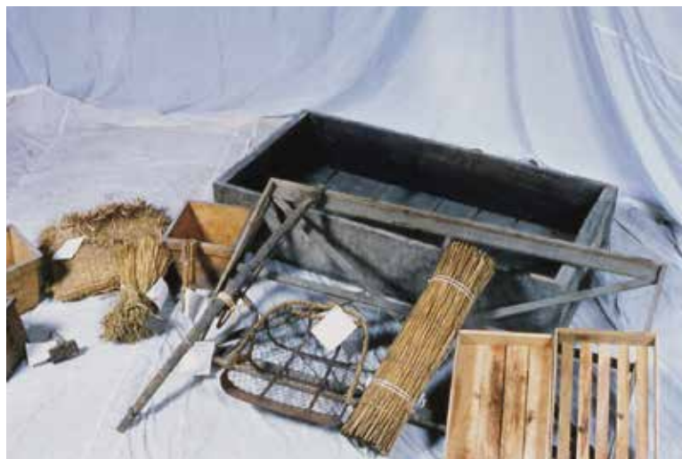
みが 身欠きニシン製造関係用具