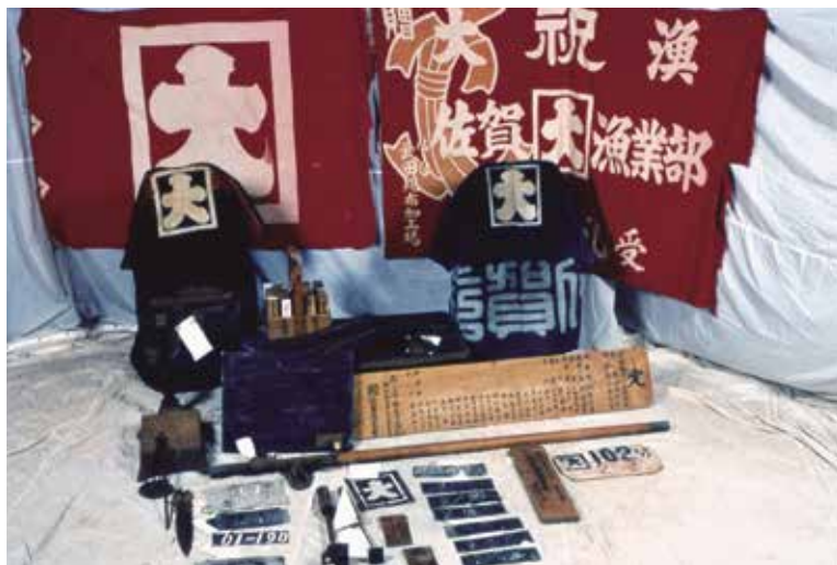
出荷・ けいえいかんけい 経営関係用具