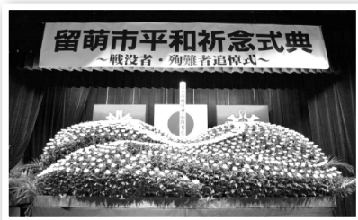
▲留萌市平和祈念式典