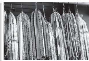
▲皆さんから寄せられた折り鶴(市役所本庁舎正面入り口)

市では、平和を祈念した折り鶴を一年を通して募集しています。下記施設内の「折り鶴専用ポスト」に投函してください。