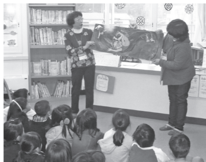
▲図書を読み聞かせ

学校図書館ボランティアは、学校図書館を主体的に運営する担当教員や児童、生徒たちの運営を補助する仕事をしています。ただし、活動内容や活動日時などは各学校によって異なりますので、年度始めに学校図書館ボランティアと学校で協議し、活動内容を決めています。