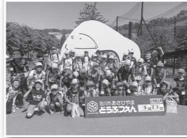
119番体験（写真上）や研修見学会（同下）などの主なクラブ活動