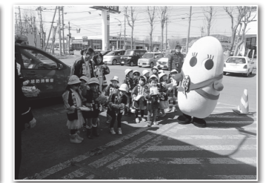
▲昨年実施した火災防ぎょ訓練（写真左）、火災予防街頭啓発（同右）