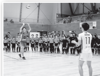
▲昨年スポーツセンターで行われたスポーツ合宿事業

市民団体が主導して誘致活動を展開している音楽合宿事業の支援をはじめ、スポーツ合宿の誘致や都市間および大学生との交流推進による関係人口の創出などの市内の資源や施設、地域力を活用しながら、交流人口のさらなる拡大を目指します。