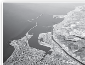
▲市内北西部に整備されている港湾施設「留萌港」

安全な離着岸および荷役作業の安全確保のため、道北地域の物流拠点港としての役割を持つ「留萌港」港内の保安設備を改修します。