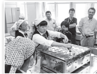
▲商品開発に取り組む留萌高校の生徒ら

地域外からのアドバイザーを招き、地元民間支援組織などが高校生をサポートし、商品開発を通じて地域ビジネスを学ぶ機会を提供します。