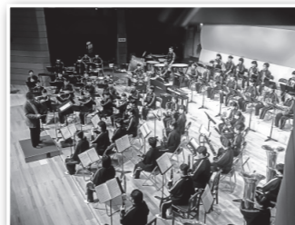
▲昨年文化センターで行われた音楽合宿事業

新たな公共施設（市役所庁舎、社会教育施設）の建て替えに向け、官民連携による協議の場を設け、施設設備に対する検討・方策協議などに取り組みます。