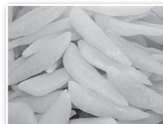
▲加工生産量日本一を誇る「留萌のかずの子」

留萌ブランドの知名度の向上や販路拡大、交流人口の拡大を図るため、道内外の都市圏で留萌観光・特産品（かずの子など）のPR支援やトップセールスなどを実施します。