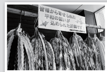
▲皆さんから寄せられた折り鶴 (市役所本庁舎正面入り口)