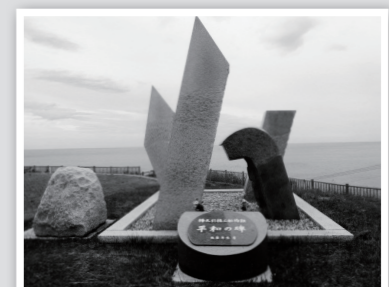
▲三船殉難事件の慰霊碑として建設された「平和の碑」

現在は移設され、海のふろさと館横の岬緑地にある平和の碑には、今でもたくさんの方が訪れ、犠牲者の冥福と平和への願いを祈っています。