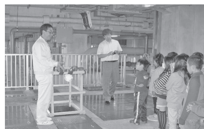
▲汚水処理の仕組みを学ぶ子どもたち