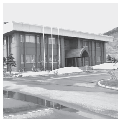
▲留萌浄化センター

下水道の整備とともに汚れた川がきれいになり、本来の生態系が復活します。留萌の美しい自然と住みよい生活環境実現のため、皆さんのより一層のご理解とご協力をお願いします。