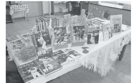
▲東光小学校の学校図書館の飾り付け