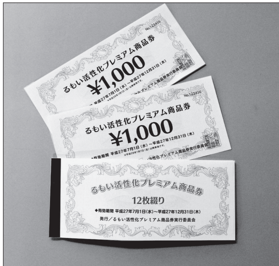
▲るもい活性化プレミアム商品券(左)と登録取扱店証