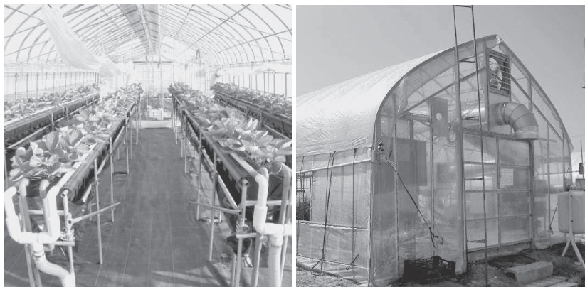
▲農業の担い手を確保するための実習施設（イメージ）

「まち・ひと・しごと創生本部」が緊急経済対策の目玉として2014年度補正予算に盛り込んだ新しい交付金は、個人消費を下支え