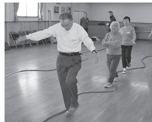
▲脳と体を使う運動をする「脳いきいき教室」の参加者