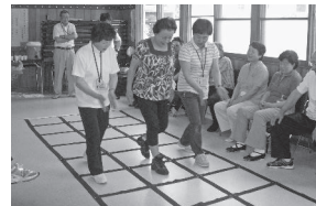
▲ふまねっと運動をする参加者

運動を楽しみながら、運動習慣を身に付けることを目的に開催している出張運動教室です。