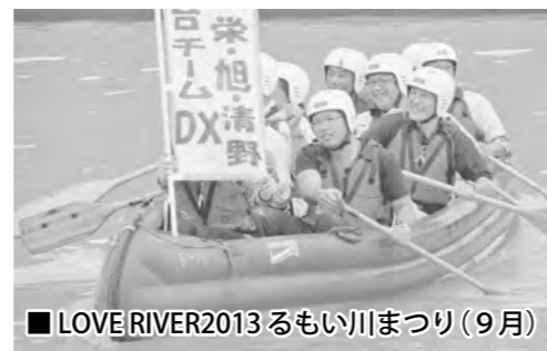
■LOVE RIVER 2013 るもい川まつり (9月)