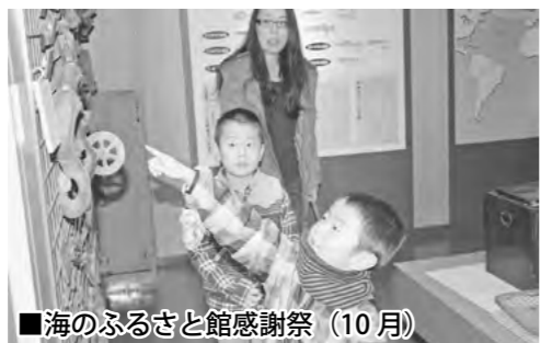
■海のふるさと館感謝祭 (10月)