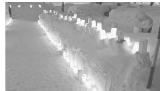
▲幻想的な雰囲気を演出するキャンドル