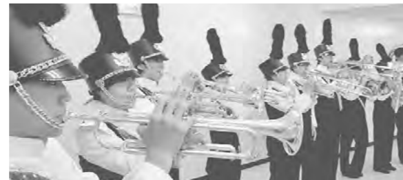
▲本番を前に練習に余念がないメンバー