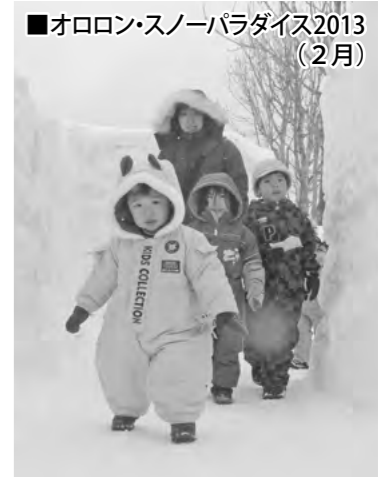
■オロロン・スノーパラダイス2013 (2月)