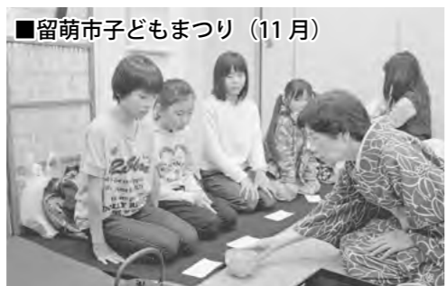
■留萌市子どもまつり (11月)