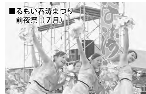
■るもい呑湊まつり 前夜祭 (7月)