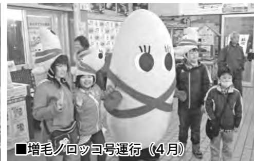
■増毛ノロッコ号運行 (4月)