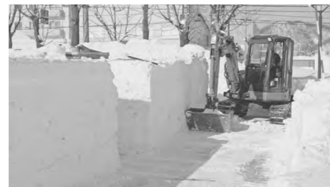
▲迷路のコースを丁寧に削り出すパワーショベル