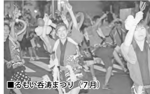
■るもい呑湊まつり (7月)