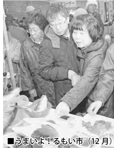
■うまいよ！るもい市 (12月)