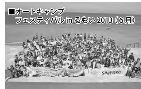
■オートキャンプ フェスティバル in るもい 2013 (6月)