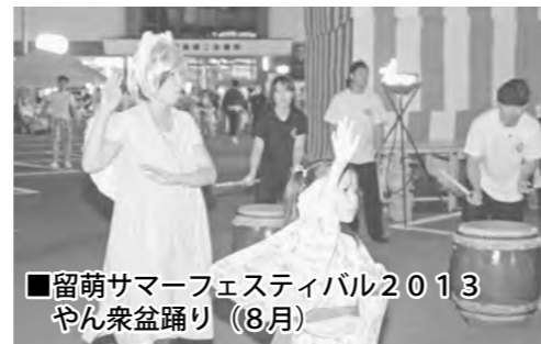
■留萌サマーフェスティバル2013 やん衆盆踊り (8月)