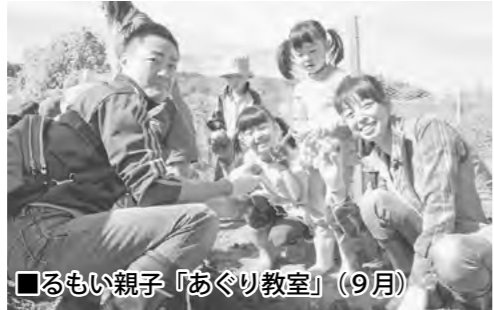
■るもい親子「あぐり教室」 (9月)