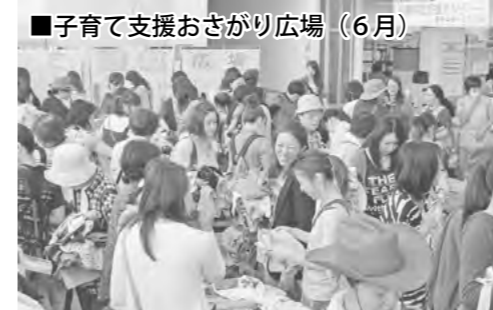
■子育て支援おさがり広場 (6月)

市では、昨年「留萌まるごと体験・体感物語」をテーマとして取り組み、多くの市民の皆さんの元気や喜び、笑顔と出会うことができました。