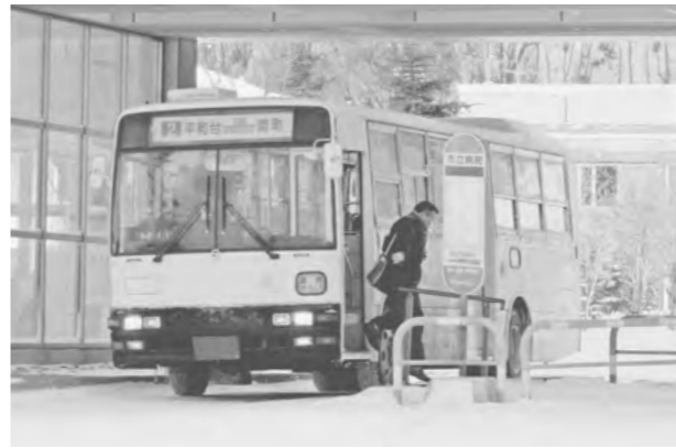
▲今後、重要性が高まる地域公共交通

しかし、マイカーの普及や人口の減少などにより、地域公共交通の利用者は大幅に減少しています。このような状況が続くと、公共交通事業者の収益が減少し、運賃の値上げや便数の削減、路線の廃止につながり