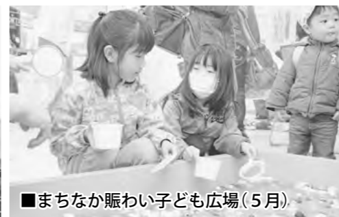
■まちなか賑わい子ども広場 (5月)