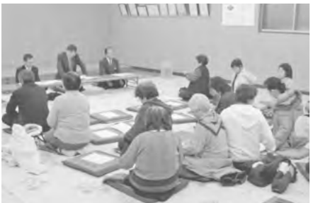
▲活発な意見が交わされた地域懇談会