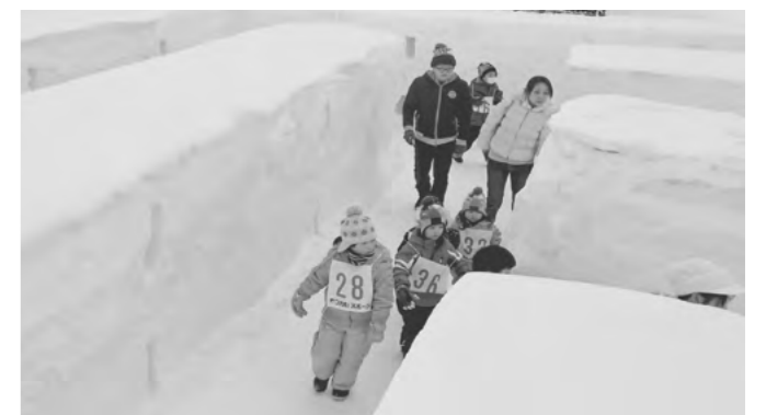
▲全長200メートルの迷路に子どもたちは大喜び