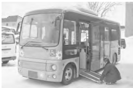
▲小型の低床バスを導入

最も利用されているのが、見晴町6丁目午前10時発の第2便で、6,770人と全体の約35・3%を占めています。また、冬季に利用者が増加することが分かりました。