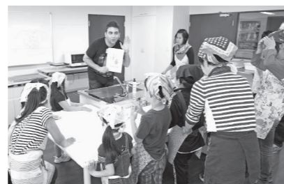
▲英会話を学ぶ子どもたち