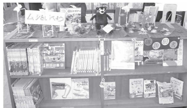
▲図書館ボランティアの主な活動(図書室の飾り付け)