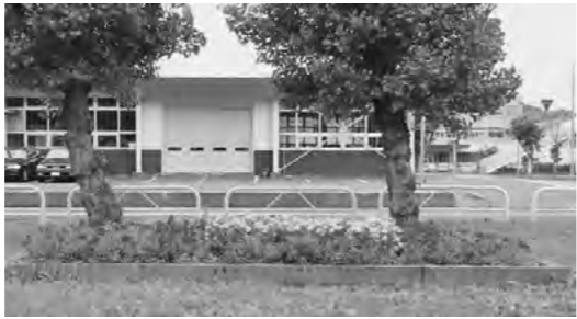
▲町内会の皆さんが整備した花壇(花園東公園)

コミュニティ施策のあり方、そして活性化策などについて改めて検討していく時期にきている。地域コミュニティ衰退の要因と再生に向けての方策をどのように考えているのか聞きたい。