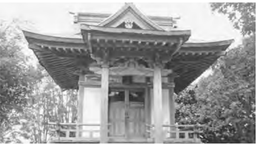
▲損傷と腐食が進む湊神社

今冬の雪害による建物の損傷や腐食があり、湊神社の姿は見るに堪えない状況と聞いている。どのように感じているか。