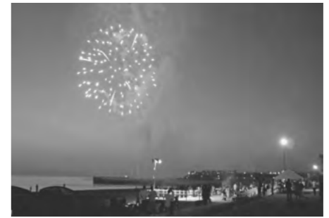
▲留萌海岸花火大会

思いのほか好評であったが、どのような効果があったか。 A 直接的に効果の検証は出来なかったが、雑誌などにも取り上げられ、知名度向上の効果はあったと思う。