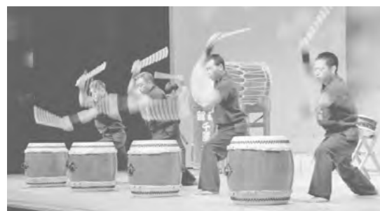
▲魂を揺さぶる力強い太鼓演奏