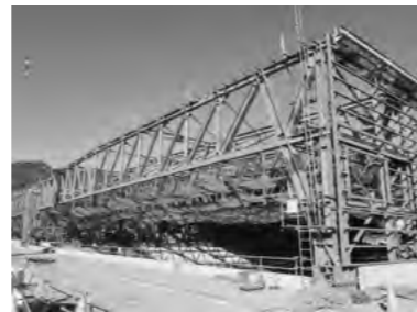
▲建設中の最終処分場

昨年までの施設に比べ重量感が増し、鋼材の材質が堅強なものになったのが目視で確認できた。