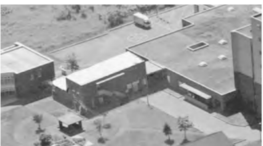
▲医師確保を目指し建設する新施設整備完成図

「要支援一」と「要支援二」認定者の現状と、国が進めようとしている要支援一、二の認定者を介護保険制度から外し、市町村に委ねよ