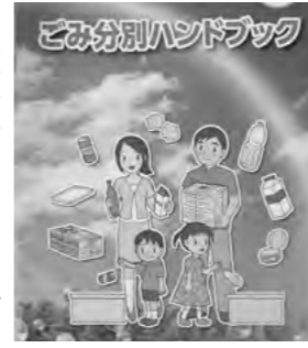
▲ごみ分別ハンドブック

A 四十五回開催し、五百二十四人が参加。主な申し込みのうち、三十二件が新しいごみ処理についてであり、新しいごみ処理については、ごみ分別ハンドブックを見ながらの説明を行い、その後は広報誌や美・サイクル館だよりで周知した。そのほか、八件が防災についてであった。