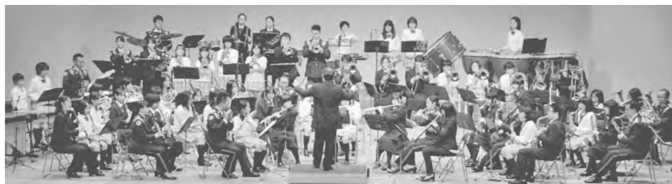
▲出演者が一同に揃い美しい調べとダイナミックな演奏の調和で観客を魅了する合同演奏