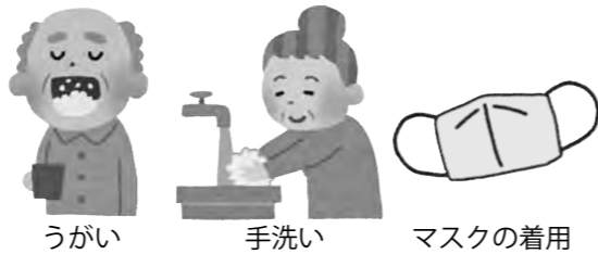
うがい 手洗い マスクの着用

○予約が必要な場合などがありますので事前にご確認ください。また接種時に年齢が確認できる書類をご持参ください。