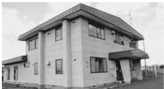
▲指定管理者制度で運営している施設

「問二」平成十五年に、地方自治法の一部改正により、公の管理制度として「指定管理者制度」が導入され、留萌市においても、現在十七の施設が指定管理者制度で運営され、八年を経過しようとする中で、さまざまな課題が明らか