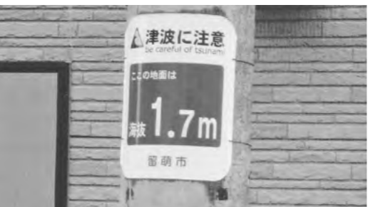
▲電柱に設置している海拔表示版

研究者によると、日本列島から樺太にかけて日本海を縦に連なる地震帯があり、その中で唯一利尻島沖に、少なくとも二百年以上にわたって、地震のエネルギーをため