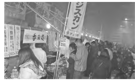
▲来場者の食欲を刺激するグルメ屋台