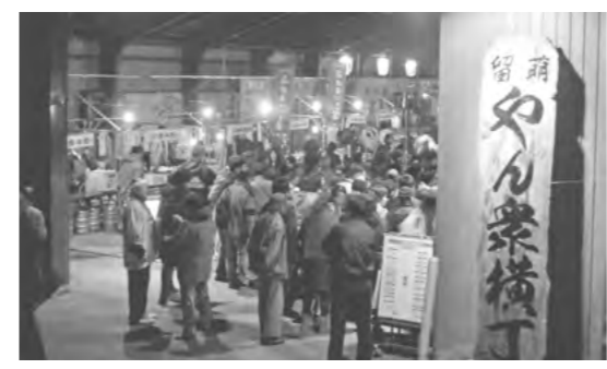
▲たくさんの来場者で賑わうやん衆特設会場