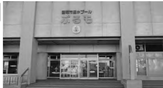
休止中の温水プール「ぶるも」

したと考えている。職員給与については、市立病院改革プランの進捗状況や地方交付税の動向などをしっかりと見極め、総合的に判断したい。