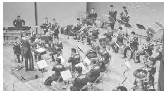
▲息のあった演奏は感動のひとつ