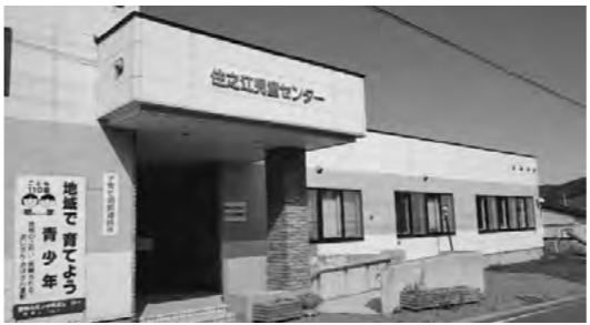
子どもたちが放課後を過ごす児童センター