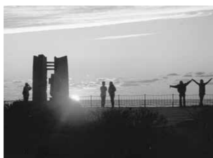
○黄金岬の夕陽 日本一の夕陽で知られる黄金岬。観光シーズンになると多くの人々が訪れ、ロマン誘う夕景を楽しみます。