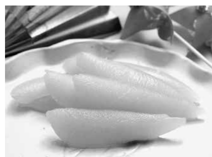
○留萌のカズノコ 日本一の生産量を誇るカズノコなどの農・水産物のブランド化と一体となった観光のPR。

留萌市観光振興ビジョン2013の詳細は、市ホームページ ( http://www.e-rumoi.jp/ ) をご覧ください。