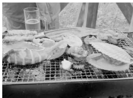
○るもい浜焼き 留萌の特色を活かした食文化のブランド化として、現在、売り出し中の「るもい浜焼き」。