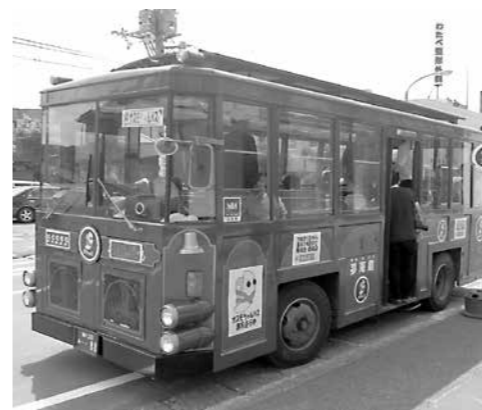
▲レトロバス「カズモちゃん号」

留萌は、国内や道内の有名観光地に比べ、知名度の高い観光資源はありませんが、歴史や文化、豊かな自然の景観やさまざまな施設、イベント、スポーツ大会などを通して観光振興に力を入れており、近年では、