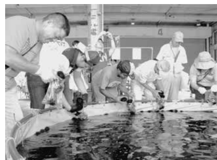
○うまいよ！るもい市 ウニの詰め放題が人気のうまいよ！るもい市。観光客のほか、市民の皆さんにも好評です。