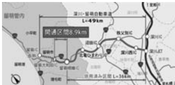
図 留萌開発建設部 道路計画課