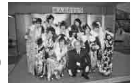
平成24年留萌市成人式にて