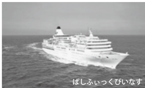
ばしふいっくびいなす

26,594総トン、全長183.4m、幅25m、喫水(海面から船底まで)6.5m、乗客定員644名