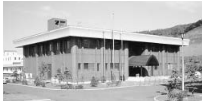
今年4月で20年目を迎える留萌浄化センター

留萌浄化センターは今年度で20年を経過し、各施設の老朽化が目立ち、今後、日常的な維持管理作業のみでは施設を維持していくことが困難な状況ですので、※「長寿命化計画」に基づき、平成24年度から平成27年度までの4ヶ年で更新工事を実施していきます。平成24年度につきましては、処理場の心臓部である中央監視設備と水処理施設を施工します。