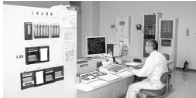
24時間365日監視の中央監視室