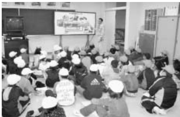
浄化センターで下水道について学ぶ 東光小学校4年生（平成22年9月28日）

▼「下水道の日」が全国一斉にスタートします。 今年も市民の皆さんに浄化センターを一般公開して、処理場と下水道の役割などを担当者が分かりやすく説明します。ぜひお越しください。 ◆日時 9月8日(木)～9日(金) 11時～、14時～の2回 ※希望者の皆さんは、右記の時間までに浄化センターにお集まりください。 ▼問い合わせ先 市・上下水道事業課 ☎42・2049