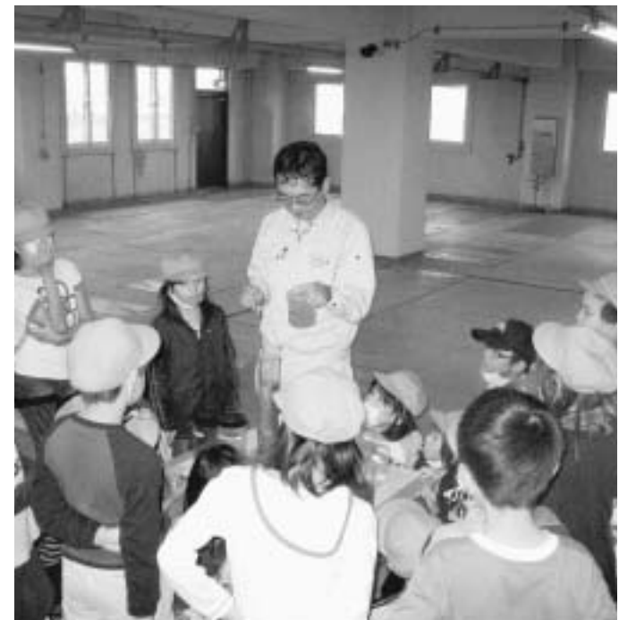
浄化センターの処理棟を見学する東光小学校4年生 (平成22年9月28日)

昭和36年に「全国下水道促進デー」として制定され、普及促進を目的に全国一斉にスタートしましたが、下水道の大きな役割の一つである「雨水の排除」を念頭に、台風シーズンである210日過ぎた220日（立春から数えて）が適当であるとされ、また旧下水道法が制定されてから100年を迎えたことから、より親しみのある名称として「下水道の日」に改称されました。 なお、「下水道の日」の期間は9月10日を中心とした前後1週間です。