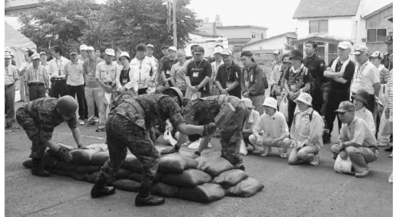
平成22年度留萌市民防災訓練の「土のう積み説明」の様

先月号では「津波発生時における避難」と「自助・共助」について、お知らせしました。今月号では、「今後の防災対策」について、そのスケジュールとあわせてお知らせします。