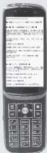
携帯電話の 受信イメージ