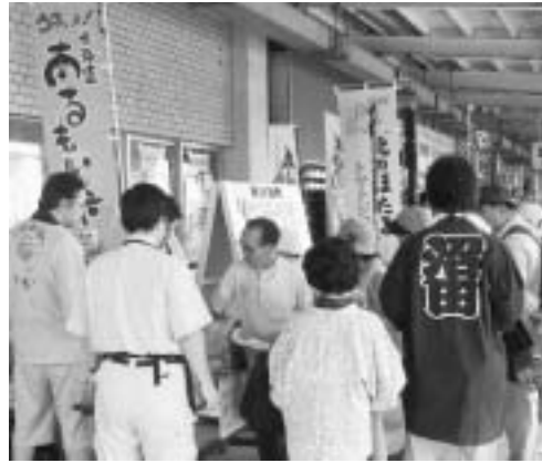
食のブランド化、食育に関する事業

留萌市では、平成20年9月に「若者たちが萌えるまち」留萌市応援寄附条例を制定し、「ふるさと・るもいの応援団」からの寄附によるまちづくりを進めています。