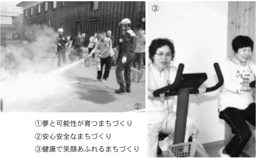
①夢と可能性が育つまちづくり ②安心安全なまちづくり ③健康で笑顔あふれるまちづくり