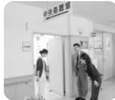
⑥検査は、約20分で終了します。お疲れ様でした。

※①②④⑪で、正確な数値を必要とする方は、食後12時間以上経過した後に検査を実施して下さい。