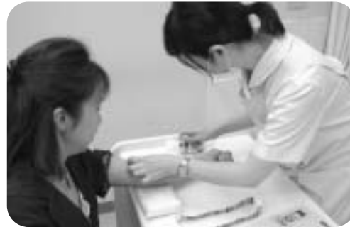
⑤中央処置室で採血します。(検査メニューにより、CTなど増えます)