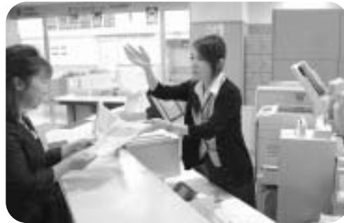
②総合案内窓口で受付します。