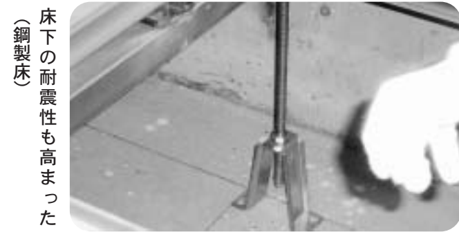
床下の耐震性も高まった(鋼製床)