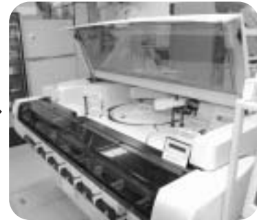
生化学自動分析装置で測定します。