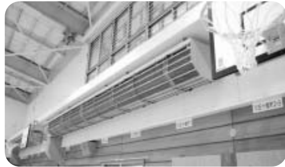
遠赤外線暖房機の新設で冬も暖か