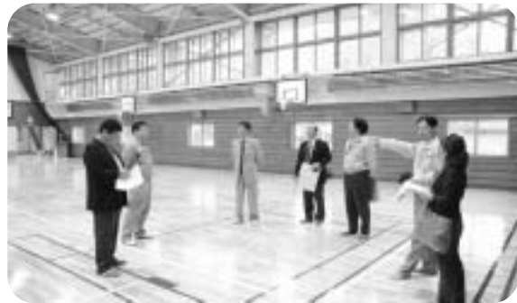
研磨と塗装でピカピカになった床