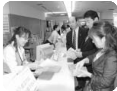
②料金を支払います。(検査メニュー項目によって異なります)