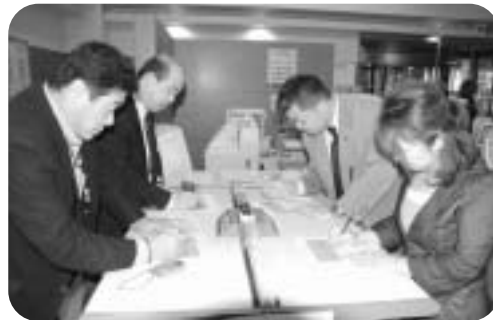
①プチ健診申込用紙兼実施票に記入します。