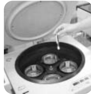
採血した血液を自動遠心分離機にかけます。