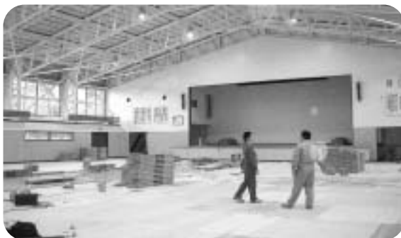
照明器具改修で明るい体育館になった