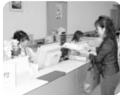
④中央検査室受付カウンターに書類を提示します。