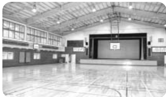
子どもたちが待ち望んだ安心・安全な体育館