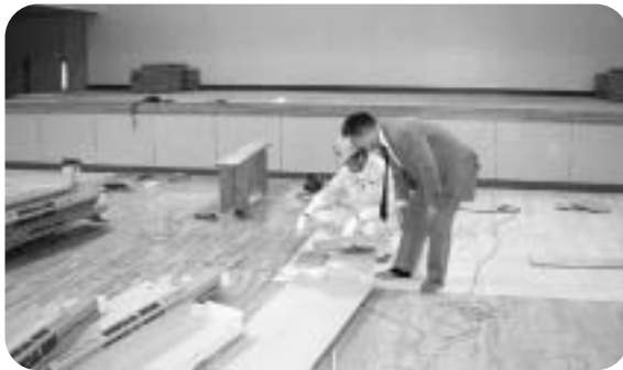
一枚一枚の手作業で進む床フローリング作業