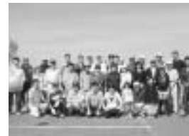
昨年の活動「ゴミ調査」を終えて