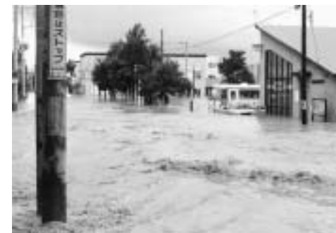
▲昭和63年8月洪水(留萌開運郵便局前)

■留萌川の洪水と安全対策 留萌川流域は過去より、たびたび洪水の被害に遭っており、戦後から現在までに15回の洪水被害を記録しています。 中でも昭和63年8月の洪水は、市街地の約3分の1が浸水するなど大きな被害がありました。 こうした洪水災害から留萌川流域を守るため、洪水の流量を調節することを目的とした大和田遊水地が今年3月末に完成します。 また、これにあわせて今年3月末に完成の留萌ダムでも洪水調節が可能となり、留萌川の洪水に対する安全度が向上します。