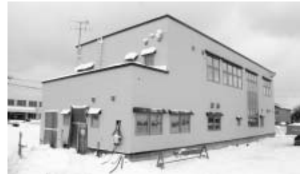
問 留萌南部森林管理署 ☎ 42・2515