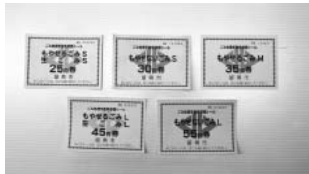
▲旧指定ごみ袋用の差額シール