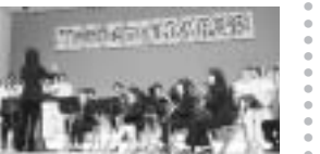
昨年の留萌げんきmoriMORI音楽祭