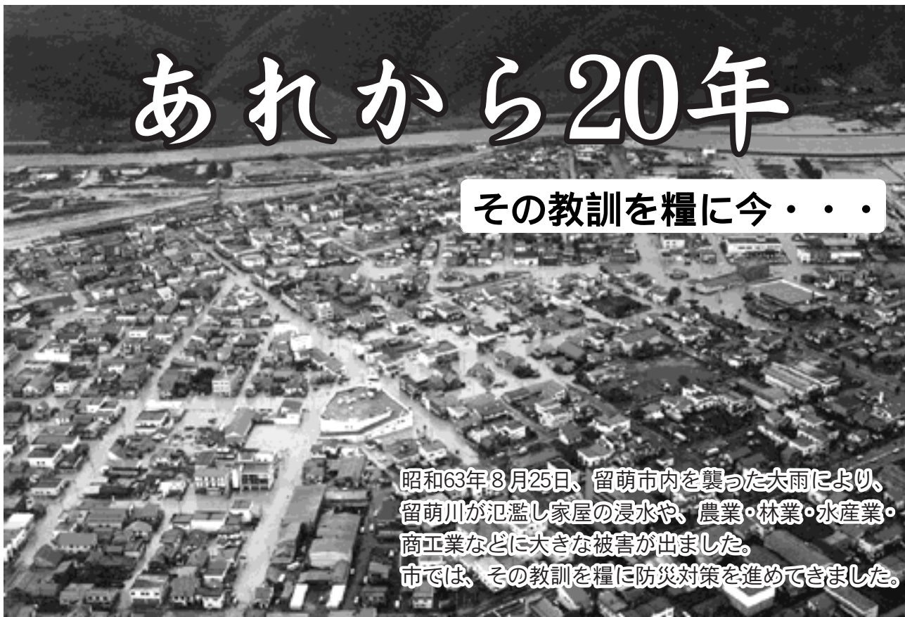
昭和63年8月25日、留萌市内を襲った大雨により、留萌川が氾濫し家屋の浸水や、農業・林業・水産業・商工業などに大きな被害が出ました。市では、その教訓を糧に防災対策を進めてきました。