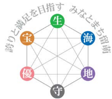
※第5次総合計画シンボルマーク

第5次総合計画では、留萌という“キャンパス”に、市民が留萌をどんなまちにしたいのかという“未来図”を、それぞれの“パレット”（色分けされた6つの政策）で描くものとして6つの色と、それぞれのシンボル文字を定め、留萌を彩る6つの基本政策「やる気と活気（もえぎ色）【生】」「思いやりと安心（珊瑚色）【優】」「自然と資源（つるばみ色）【地】」「暮らしと安全（しろがね色）【守】」「夢と宝（こはく色）【宝】」「海と港（るり色）【海】」を定めました。