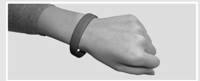
※認知症サポーターの証「オレンジリング」