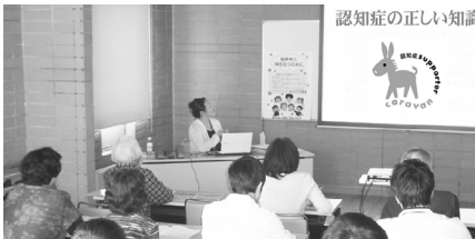
認知症の正しい知識